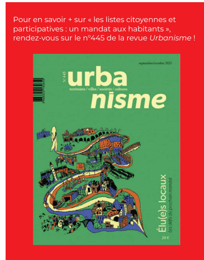
Pour en savoir + sur « les listes citoyennes et participatives : un mandat aux habitants », rendez-vous sur le n°445 de la revue Urbanisme !

Face à ces constats, comment pouvons-nous penser ensemble à un renouveau démocratique dans un contexte de défiance, de crise de la représentation, des vocations, voire de l'engagement ? Face à un risque de retour en arrière et de balayage voire de rejet de la participation citoyenne, au nom de la simplification administrative par exemple 10 , comment pouvons-nous penser les conditions de la coopération ? Comment un territoire peut-il requestionner son cadre d'intervention et de décision ?